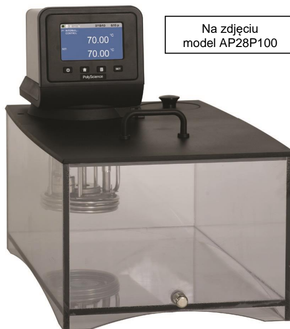
Na zdjęciu model AP28P100