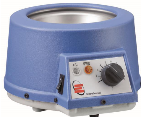
Czasza grzejna serii EMX

W płaszczach serii EMX zamiast siatki zastosowano pełny ekran ze stali nierdzewnej chroniący element grzejny przed zalaniem.